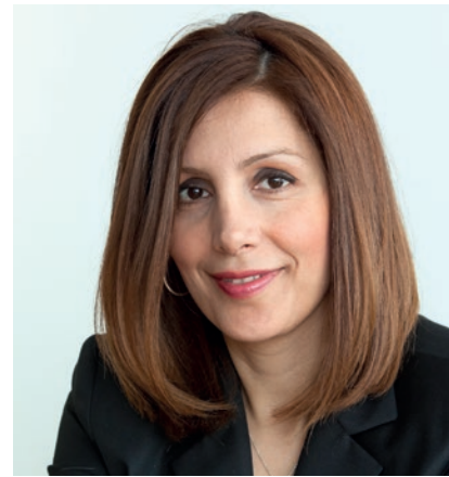
Bilkay Öney Ministerin für Integration des Landes Baden-Württemberg