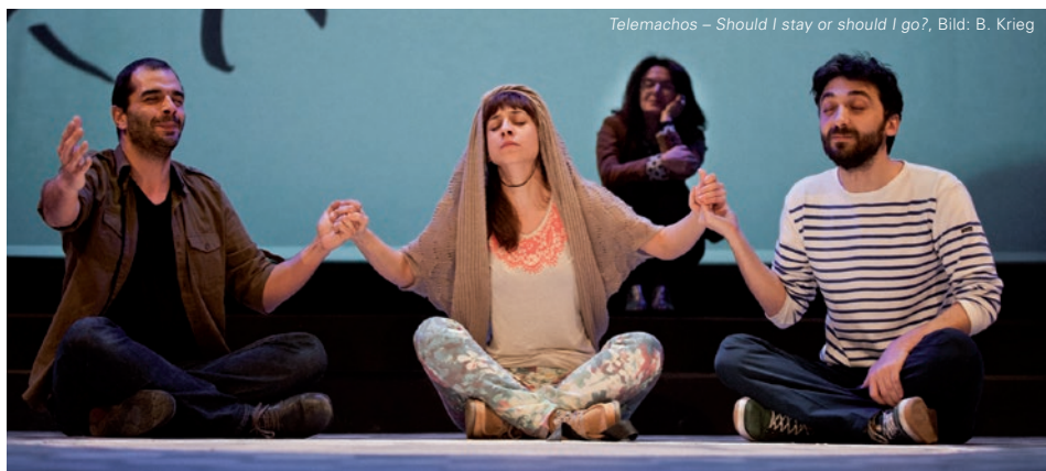
Telemachos – Should I stay or should I go?

„Die“ Migrantinnen und Migranten gibt es nicht, und es gibt auch nicht „die“ ▶ Flüchtlinge, genauso wenig wie es „die“ dritte Generation gibt. Es gibt auch keine in sich abgeschlossenen, klar zu definierende „Kulturen“. Eine jede (z. B. für gruppenspezifische Angebote) zu konstruierende Gruppe besteht aus Individuen mit unterschiedlichen Erfahrungen, Werten und Entwicklungsdynamiken, und folglich natürlich auch mit unterschiedlichen kulturellen Interessen und Bedürfnissen. Es geht darum, Menschen als Menschen zu behandeln, aber gleichzeitig ihre Ethnie nicht wegzudenken, da diese eben auch ein Teil ihrer Identität ist. Bei allen Maßnahmen ist das Verbindende ebenso zu sehen wie das Trennende . ▶ Diversitätspolitik