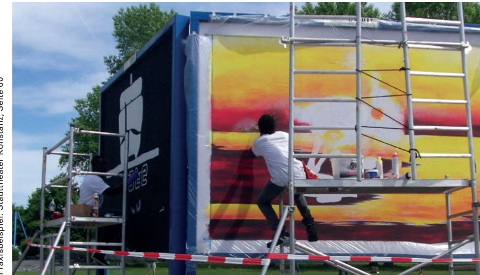
Praxisbeispiel: Stadttheater Konstanz, Seite 60

häufigsten vertretenen Sprachen benutzt werden, erreicht man nur einen Teil der migrantischen Bevölkerung). Die Verwendung von Englisch kann zur besseren Ansprache (nicht zuletzt von Expatriates) in vielen Kontexten Sinn machen und wird auch als wichtiges Zeichen für Weltoffenheit und internationale Orientierung wahrgenommen. Aber auch das Englische spricht bei weitem nicht alle Migranten-Communities an und findet bei manchen wegen seiner „West-Zentriertheit“ auch keine Akzeptanz. ► Mehrsprachigkeit