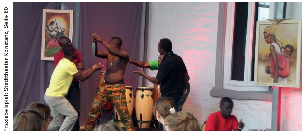
Praxisbeispiel: Stadttheater Konstanz, Seite 60

Kulturarbeit mit Geflüchteten ermöglicht wohl das Gehörtwerden und das Sichtbarmachen von Schicksalen sowie eine Sensibilisierung der Öffentlichkeit, birgt aber auch die Gefahr des paternalistischen Funktionalisierens von Schicksalen in sich. Nicht zuletzt deshalb sind interkulturelle Öffnung und eine entsprechende Kompetenz, ein reflektierter Umgang mit ▶ rassistischen Tendenzen, echte Partizipation auf Augenhöhe, nicht zuletzt aber auch das Einhalten angemessener ▶ Qualitätskriterien unabdingbare Voraussetzungen jeglicher Aktivitäten mit Geflüchteten. Die spezifischen Herausforderungen dieser Arbeit, wie z. B. traumatische