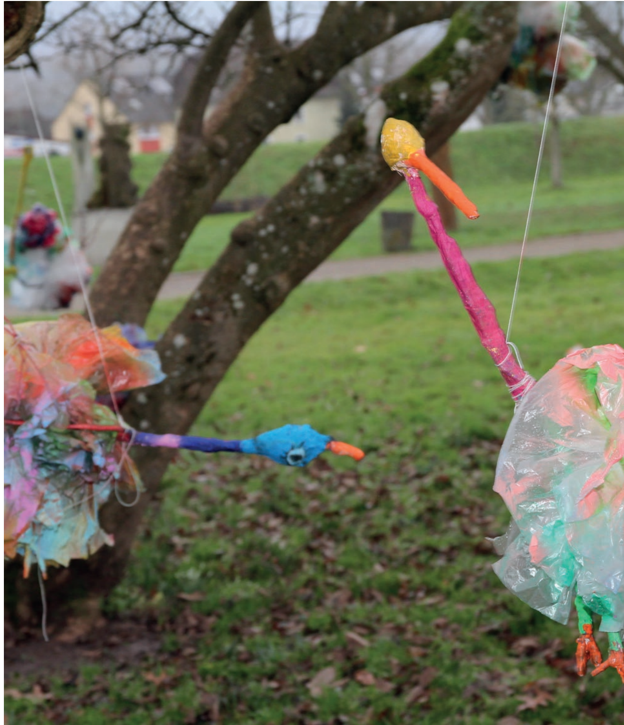
Praxisbeispiel: Akademie Schloss Rotenfels, Seite 50