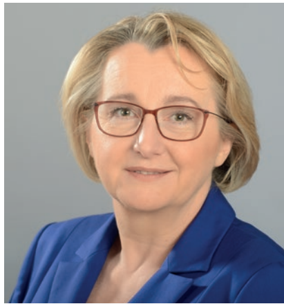
Theresia Bauer MdL Ministerin für Wissenschaft, Forschung und Kunst des Landes Baden-Württemberg