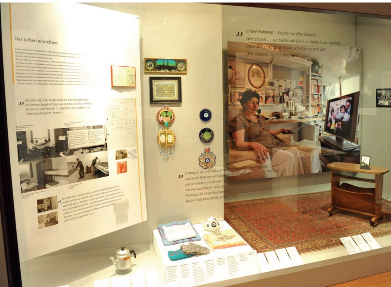
Praxisbeispiel: Merhaba Stuttgart, Seite 70