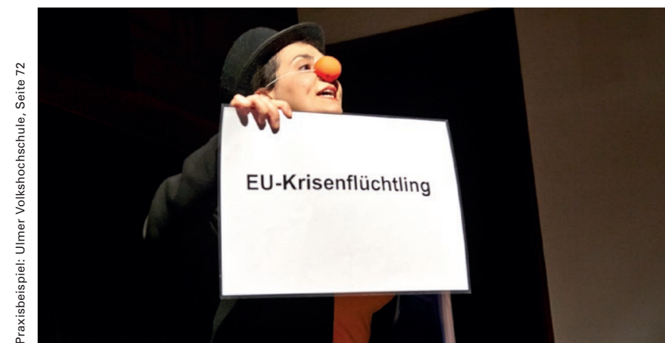
Praxisbeispiel: Ulmer Volkshochschule, Seite 72

rungsangeboten auch die Zurverfügungstellung entsprechender Ressourcen und/oder die Bezahlung einer angemessenen Aufwandsentschädigung gehören. ► Neuverteilung von Ressourcen