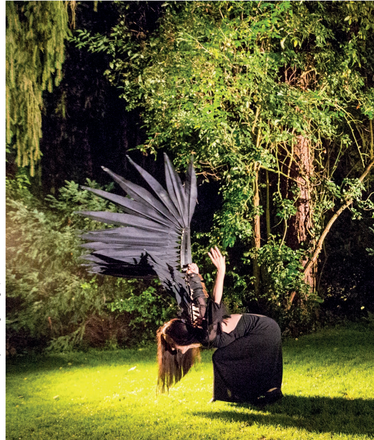
Praxisbeispiel: KulturRegion Stuttgart, Seite 66