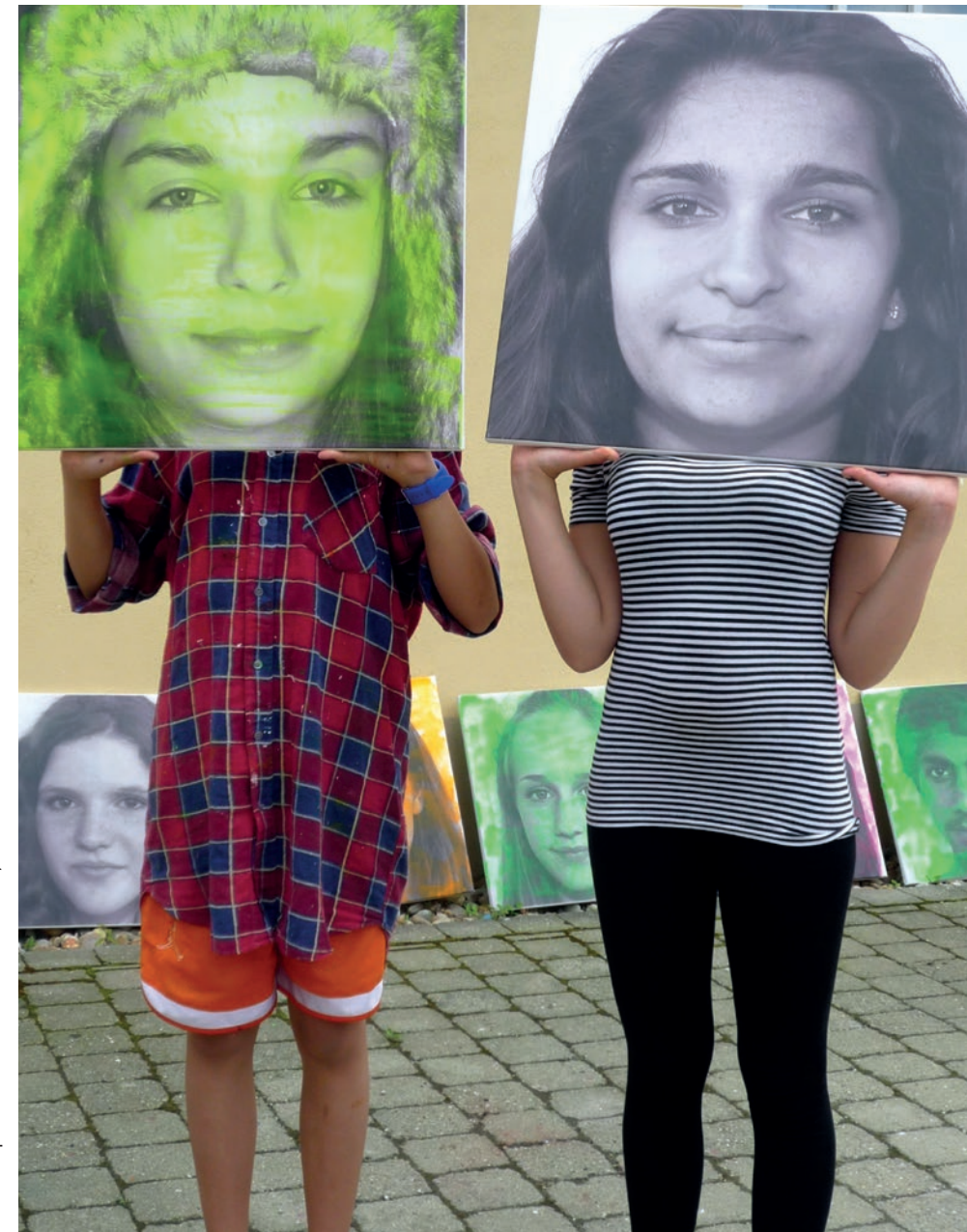
Praxisbeispiel: Akademie Schloss Rotenfels, Seite 50